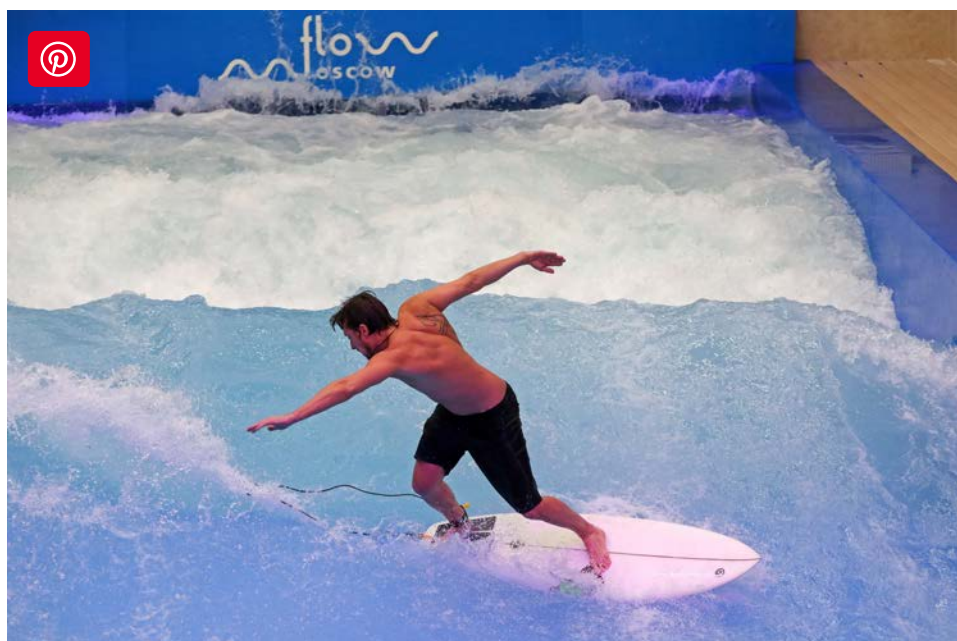
Piscina de ondas artificiais

14 Ago 2021 - 08h53 | Atualizado em 14 Ago 2021 - 09h23