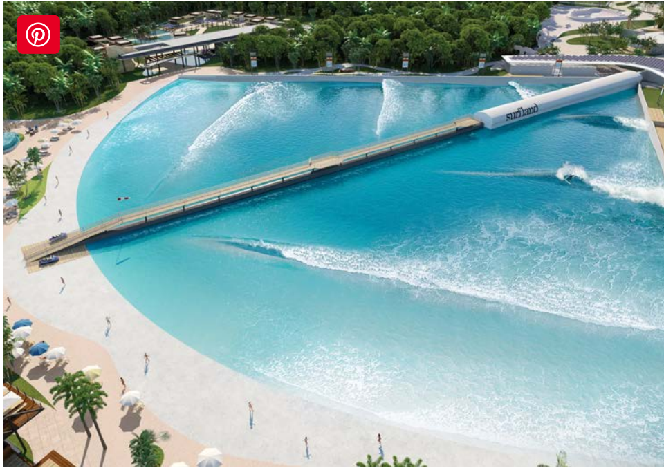
Uma nova onda: Surfland Brasil, Garopaba (SC)

Surfland Brasil, Garopaba (SC): Prevista para ficar pronta em dezembro de 2022, a piscina (ilustração 5) terá a mesma tecnologia daquela utilizada na Praia da Grama – da empresa espanhola Wavegarden, líder mundial do ramo, presente em seis piscinas de quatro continentes.