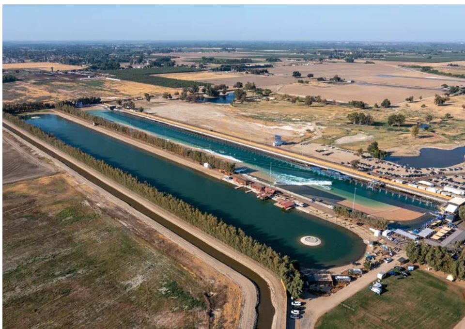
Uma nova onda: Surf Ranch, EUA

Boa Vista Village, Porto Feliz (SP): A segunda maior piscina com ondas para surfe do mundo (ilustração 8) deve ficar pronta no primeiro semestre do ano que vem. Com a tecnologia Perfect Swell, terá variedade de ondas semelhantes às da Wavegarden, mas um pouco menores (1,8 metro) e com o dobro da duração (24 segundos).