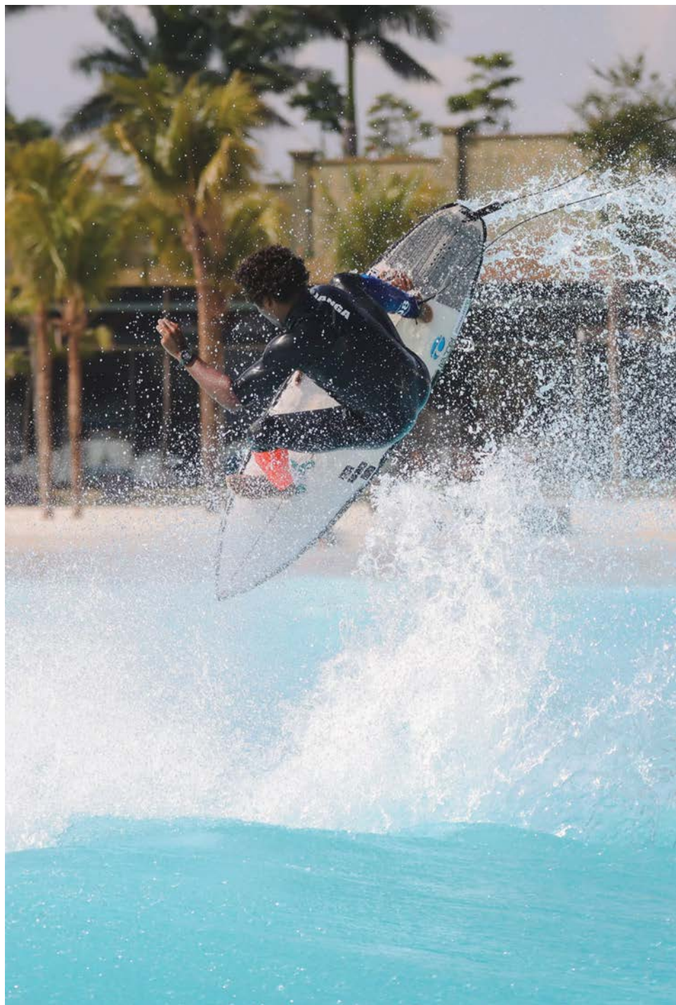
Uma nova onda: Praia da Grama