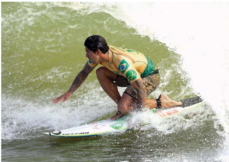
Uma nova onda: Surf Ranch, EUA