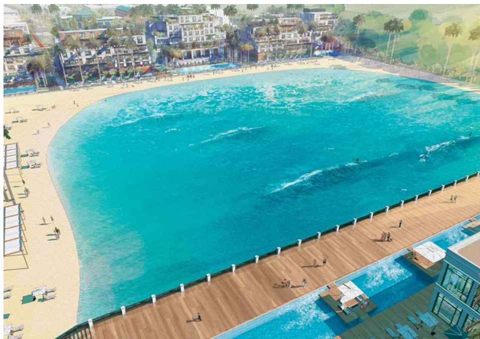
Uma nova onda: Boa Vista Village, Porto Feliz (SP)