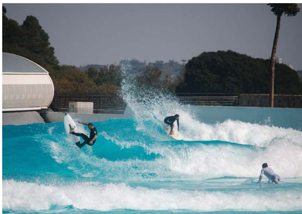
Uma nova onda: Praia da Grama